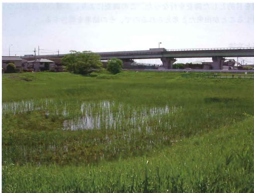
図 2. 調査地の環境 (4月).