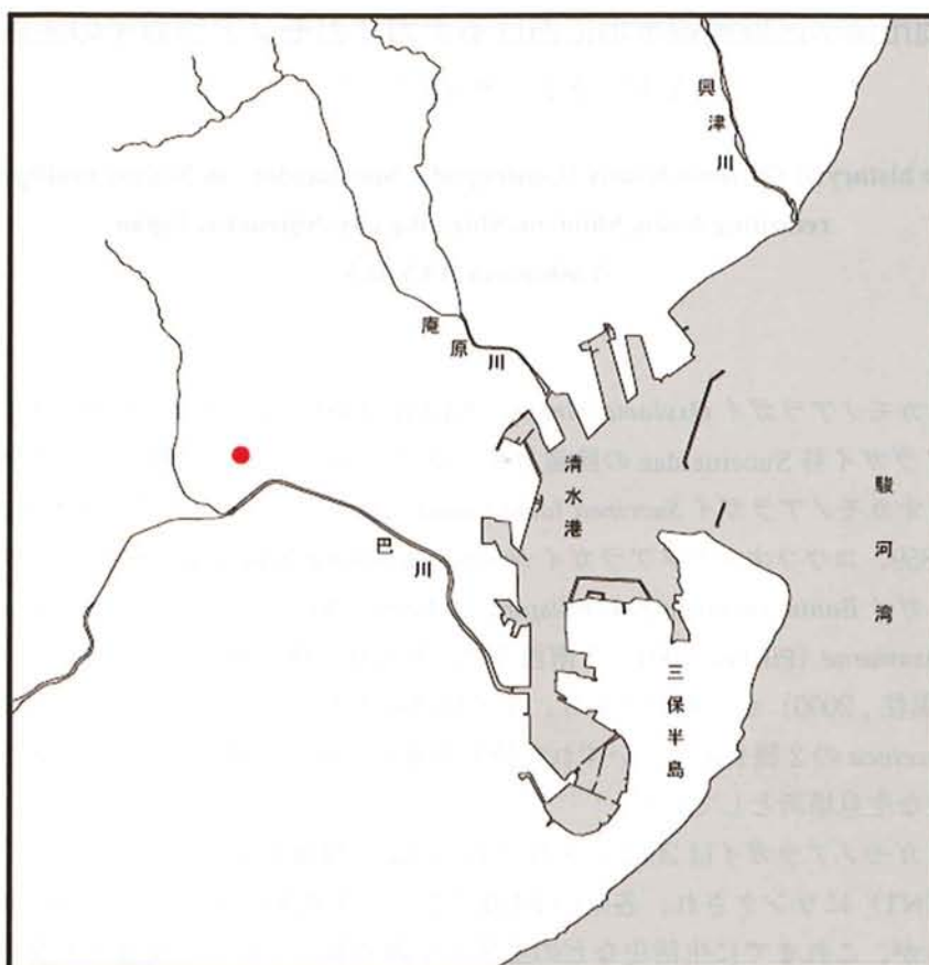
図 1. 調査地.