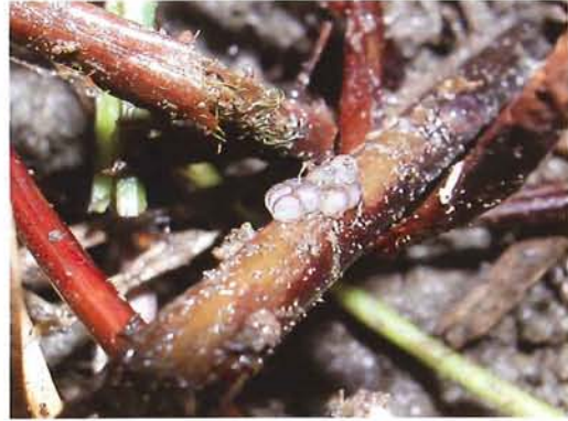
図7. 卵塊 (8月確認).