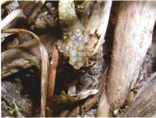
図6. 卵塊 (4月確認).