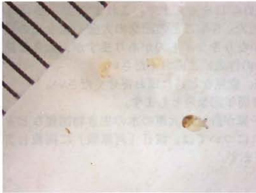
図8. 孵化直後の稚貝. スケール1目盛=1mm.