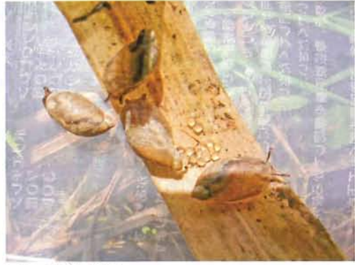
図5. 産卵 (4月).