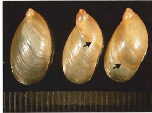
図9. 左: 春型, 中央・右: 夏型. 矢印は休止帯を示す, スケール1目盛=1mm.